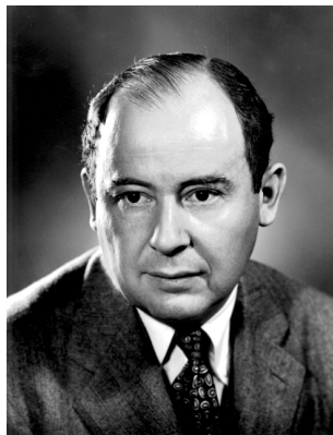
Albert Einstein (1879-1955)